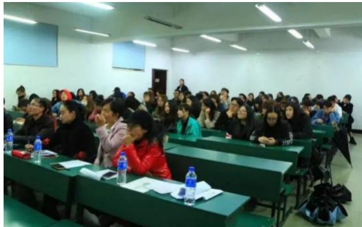
课外设计比赛指导——云南省学校民族团结教育展演大赛课外集中指导