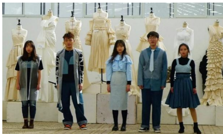
实践课程成果汇报——2016级《立体裁剪》、《服装制作工艺3（职业装）》课程汇报展

关于课程内实践教学的教学成果评价，本专业每学期组织实践课程汇报展，方便学生、教师间进行教学交流，激发学生学习积极性。