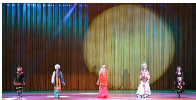
课外设计展演筹办——院内创意服饰设计展

毕业设计校外调研及毕业实习，是为学生毕业做准备，属于人才培养方案内、针对大四毕业生规划的实践活动。实践安排由学生自主安排，并由毕业设计指导教师和辅导员共同监督管理，实践内容围绕毕业设计及就业安排。实践前需由学生制定实践计划，实践后需完成实践报告。