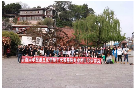
课程内校外实践（设计色彩外出写生）

关于课程内实践教学的教学成果评价，本专业每学期组织实践课程汇报展，方便学生、教师间进行教学交流，激发学生学习积极性。