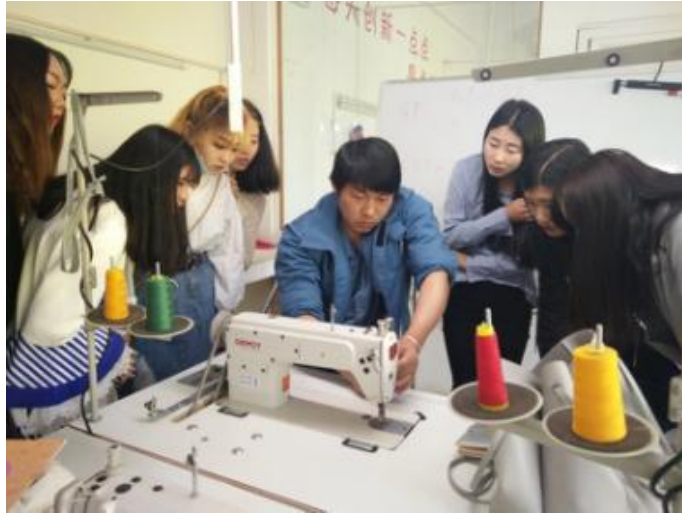
课外技能加强实践——2016级“周末课程”（风雨同舟服饰有限公司指导）