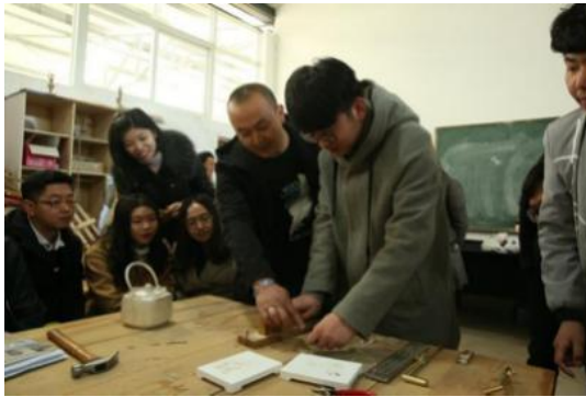
课程内校内实践（珧琅工艺大师进课堂）

课程内实践教学，是指基于课程教学需要、符合教学进度组织的实践教学，课程承担教师为主要组织者和管理者，实践具体内容均详细体现在教学大纲和进度表中，实践场所可在校内实训中心或校外；校内主要实践类型包括设计实践、技能实践、大师进课堂等，校外实践以设计调研、写生为主；若实践在校外进行，每学期初需统一上报二级学院和学校审核，以保证其有效性、合理性和安全性。